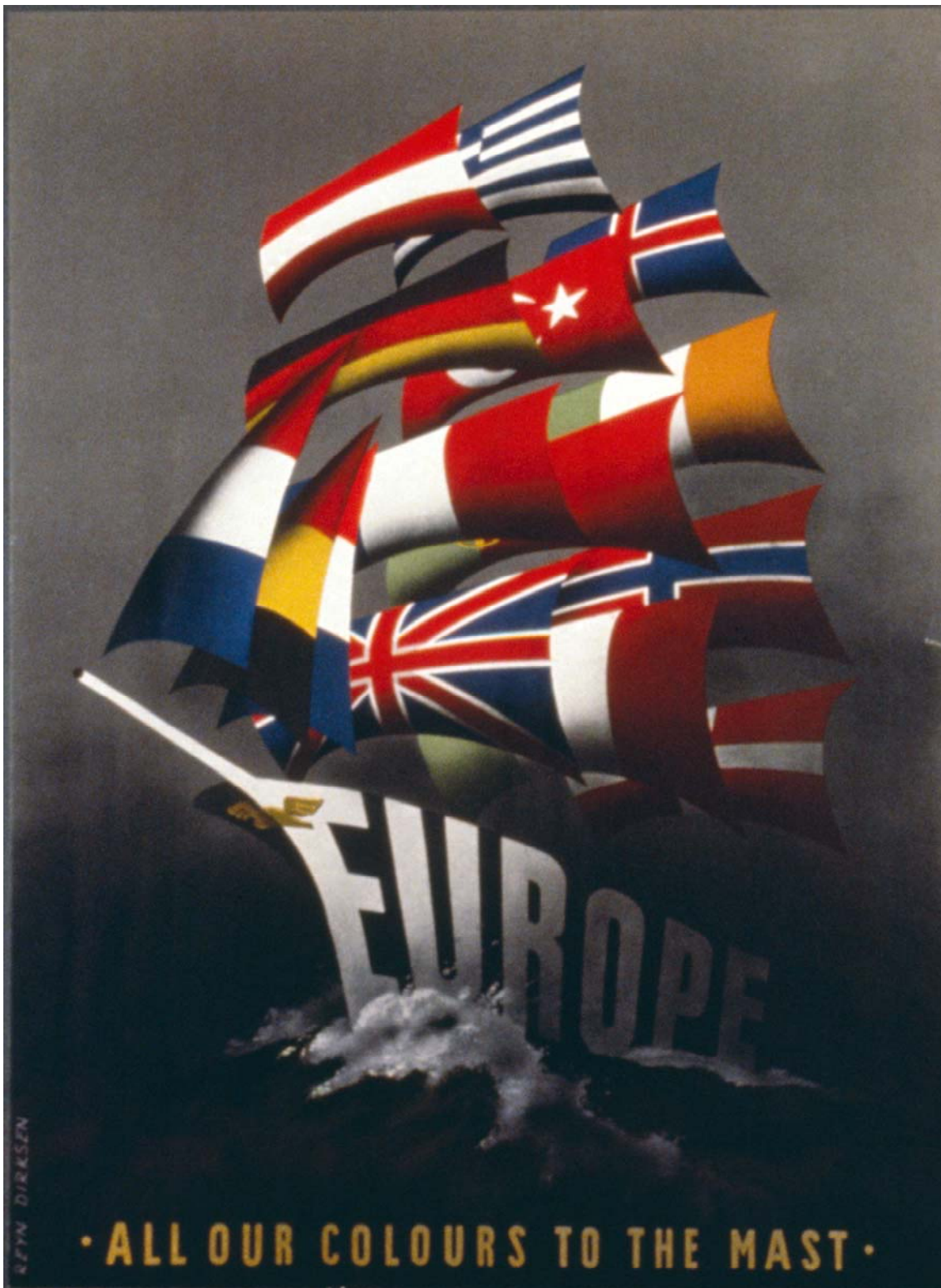
All Our Colours to the Mast – Alle unsere Flaggen hissen , Reyn Dirksen. Katalog ID 1020 (im Deutschen Historischen Museum als Plakat erhältlich; Inventurnr. 1988/1442.3.) Erläuterungen : Vorsegel = Benelux; Fockmast = ehemalige Großmächte; Hauptmast = Die Mittelmeerländer; Besanmast = nordische Länder.